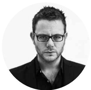
_AQUIS BY DIEGO VENCATO

Portafrutta nato dall'idea di usare l'onice - più lo si assottiglia più diventa trasparente - come se fosse un liquido, ossia: accoppiata ad un marmo, partendo da un determinato spessore per arrivare a zero. L'effetto visivo è simile a quello di una spiaggia vista dall'alto: al largo il mare è di un colore blu profondo e si schiarisce sempre di più mano a mano che si avvicina a riva, fino a diventare trasparente.