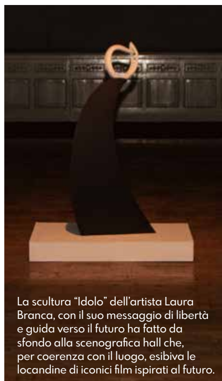
La scultura "Idolo" dell'artista Laura Branca, con il suo messaggio di libertà e guida verso il futuro ha fatto da sfondo alla scenografica hall che, per coerenza con il luogo, esibiva le locandine di iconici film ispirati al futuro.

Ambientata nella hall dello storico cinema Vittoria, sapientemente illuminato da Fogliani, main sponsor della manifestazione, e con l'indispensabile apporto di Novello Case la mostra, a cura di Cristian Visentin , - la cui penna MIA è stata selezionata all'ADI Index 2024 per il "Compasso d'oro" - con la partecipazione attiva dell'Associazione Varese Retrocomputing e dell'Associazione Lavori in Corso, era dedicata ai Millennial e alla generazione Z. Un viaggio nel passato per capire la nascita del computer e della sua evoluzione anche in termini di design, da Olivetti ad oggi, attraverso un'esposizione di pezzi rarissimi ancora funzionanti. L'iniziativa ha attirato appassionati del genere, giovani e curiosi mentre i boomer hanno riscoperto con nostalgia e una sorta di tenerezza, i computer dei tempi della loro gioventù.