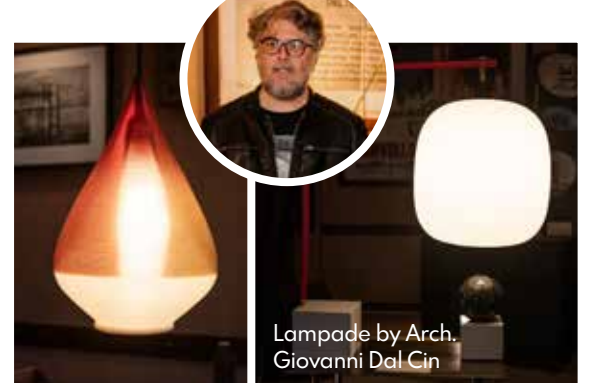
Lampade by Arch. Giovanni Dal Cin