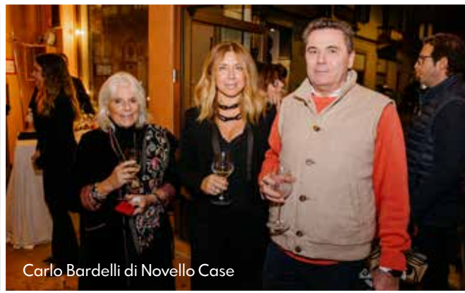
Carlo Bardelli di Novello Case