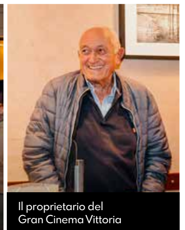
Il proprietario del Gran Cinema Vittoria