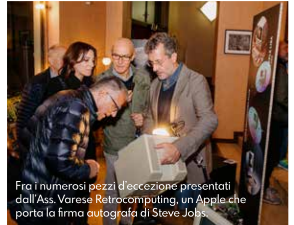
Fra i numerosi pezzi d'eccezione presentati dall'Ass. Varese Retrocomputing, un Apple che porta la firma autografa di Steve Jobs.