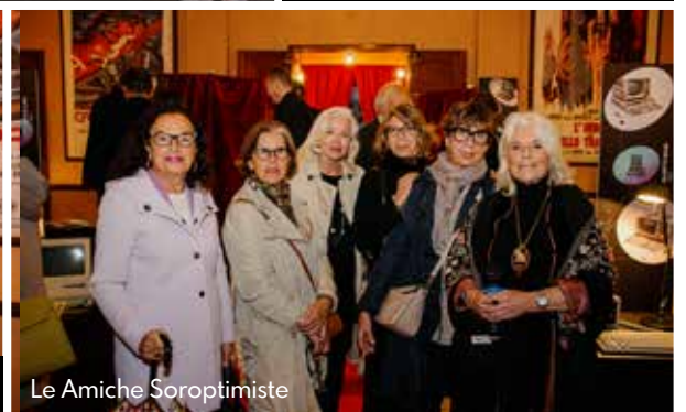
Le Amiche Soroptimiste