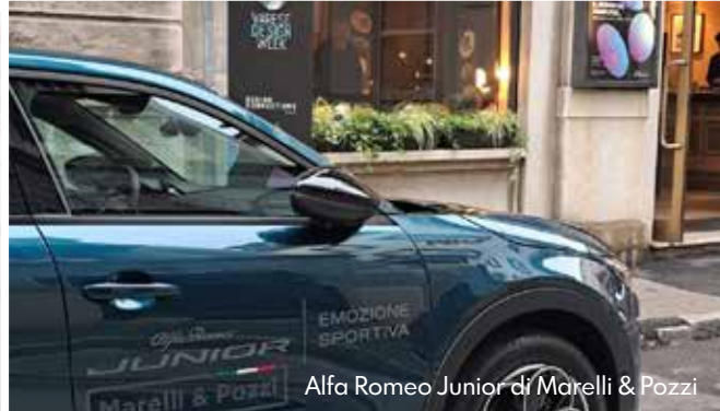
Alfa Romeo Junior di Marelli & Pozzi