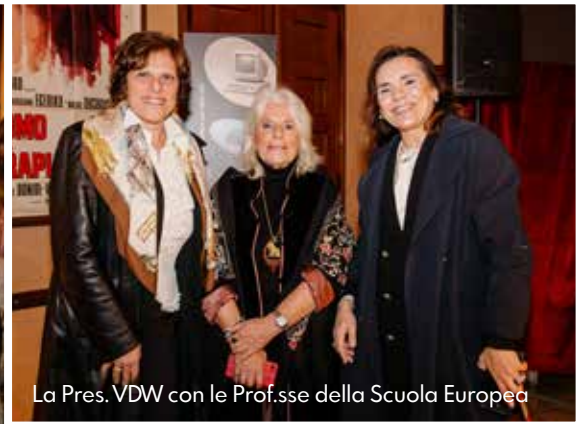
La Pres. VDW con le Prof.sse della Scuola Europea