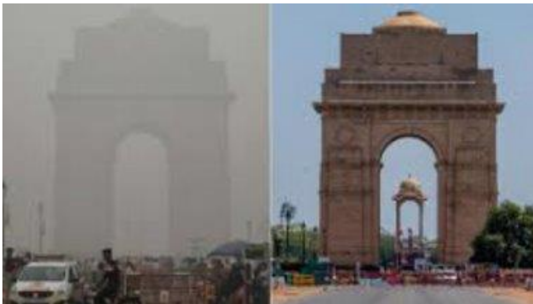
La pollution en Inde.